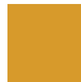
PMS 7563 C

C: 7 R: 173 M: 33 V: 132 Y: 100 B: 0 K: 33 #ad8300